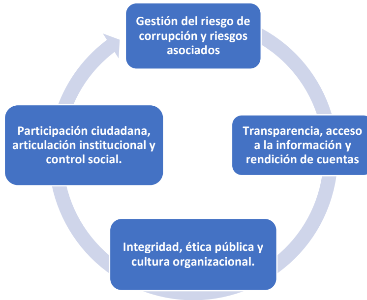
Componentes del Programa de Transparencia y Ética Pública de la EDAT S.A. E.S.P. OFICIAL – 2024